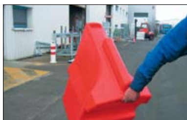
Une poignée de préhension