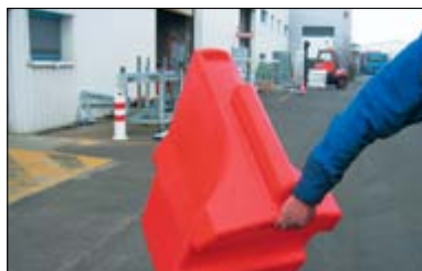
Une poignée de préhension