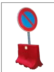
Panneau de police sur support PRF