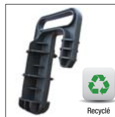
❶ Clé de liaison noire