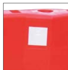
❸ Réflecteur blanc