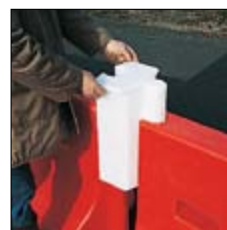
❷ Clé Balisaam blanche