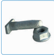
Tornillería City 1/4 de vuelta.